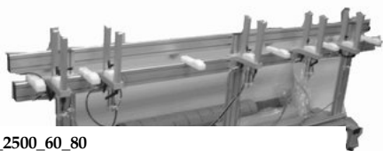
ODL_2500_60_80 2500 mm 6 pnevmatski cilindri Odlagalec za 50 kosov lamel C80 x 3800mm