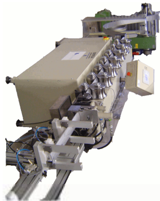
Tekacevo 60 SI - 3250 ROGAŠKA SLATINA Slovenija SLOVENIJA

Stroj za profiliranje lamel SKOVELA_SPL_120_C80_U52 žaluzij SKOVELA d.o.o.