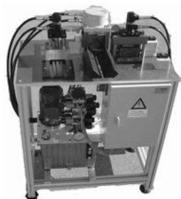
SHP_U52_C80_3_8 ŠTANCA LUKNJE REŽE DOLŽINO