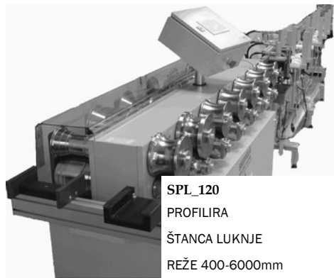
SPL_120 PROFILIRA ŠTANCA LUKNJE REŽE 400-6000mm