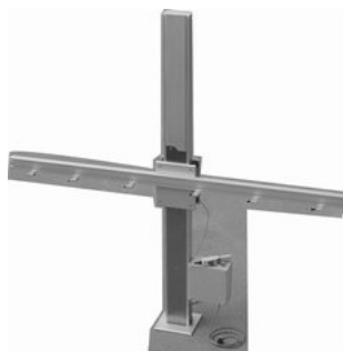
SRP_25_22 Revizijski pano